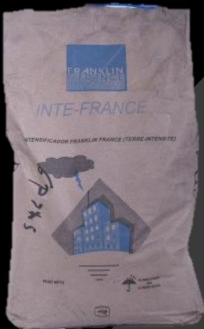
INTE-FRANCE Bulto de 11.3 kg

El almacenamiento de este producto deberá ser en un lugar seco y bajo techo.