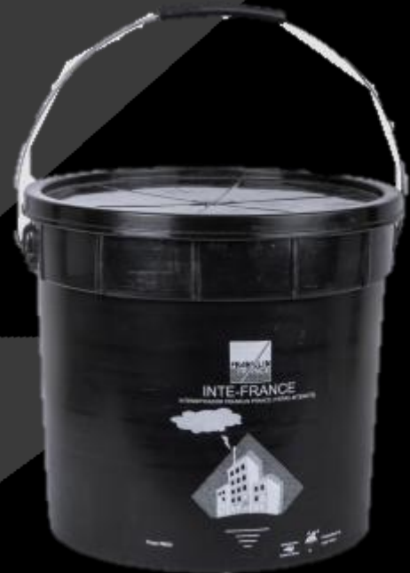
INTE-FRANCE Cubeta de 11.3